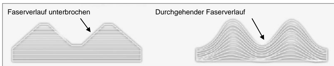
Faserverlauf bei spanend (links) und umformend (rechts) hergestellten Gewindewerkzeugen

Bei der spanlosen Gewindeherstellung mittels Gewindeformer wird die Mikrostruktur des Werkstückes nur verformt. Auf diese Weise bleibt der Faserverlauf durchgehend erhalten und wird nicht wie beim Gewindeschneiden unterbrochen. Dies führt zu einer höheren Materialstärke und Auszugskraft. So unterschiedlich wie die Prozesse für Gewindeschneiden und Gewindeformen sind, so unterschiedlich sind auch die Bearbeitungsanforderungen.