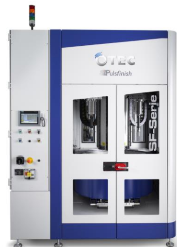
SF-Maschine mit Pulsfinish

Durch die starken Bearbeitungskräfte der SF-Maschinen mit Pulsantrieb (Pulsfinish) und dem Einsatz von hochwertigen Schleifkörpern mit hoher Abtragsleistung lassen sich die vorgegebenen Bearbeitungsergebnisse innerhalb kürzester Zeit erreichen. Abhängig von der Größe des Werkzeuges und dem geforderten Ergebnis dauert die Oberflächenbearbeitung zwischen 1 und 2 Minuten. Der Bearbeitungsprozess ist sehr flexibel und auf jede Werkzeugdimension und -form anpassbar. Streamfinishmaschinen von OTEC sind besonders